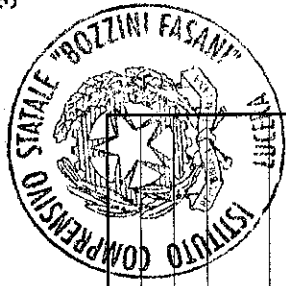
TABELLA B allegata al Contratto Integrativo d'Istituto a.s. 2018/2019